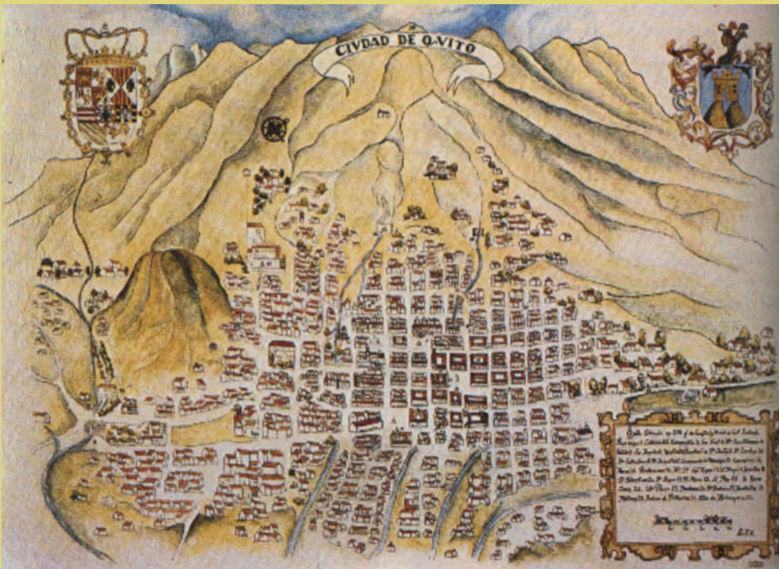
La ciudad de Quito en el siglo XVIII