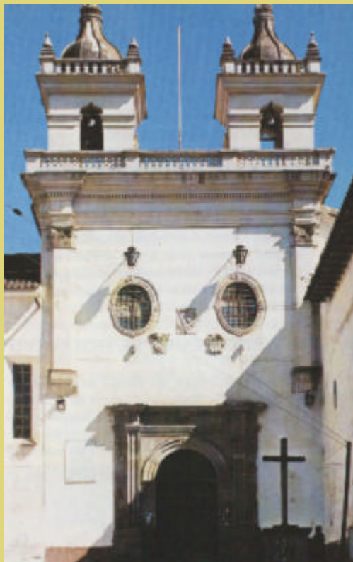
Iglesia de El Tejar de los mercedarios