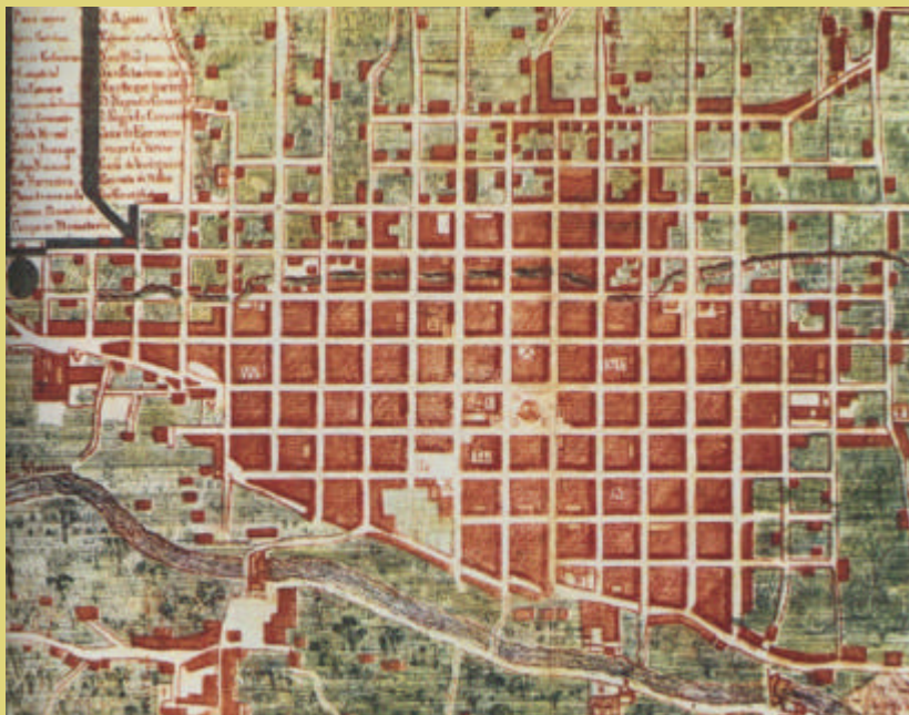
Plano de Cuenca