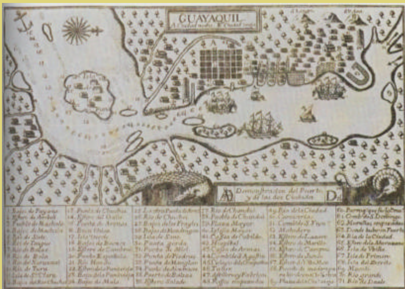
Plano de Guayaquil