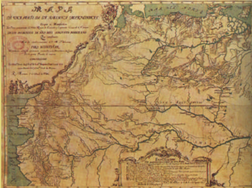
Mapa de Francisco Requena – 1783