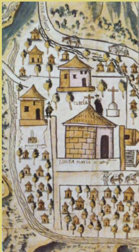
Clásica distribución de un pueblo colonial

Contenido: Voluminoso expediente promovido por Juan del Baño contra Melchor Cuadrado y Juan de Vallejo por haber atentado contra su vida.